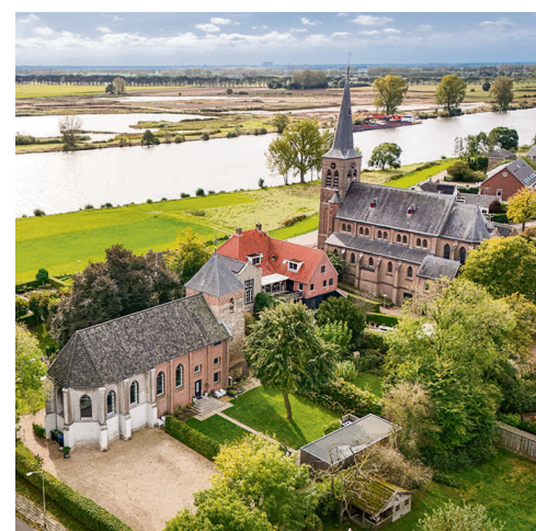
De toren van de kerk, een Rijksmonument, is ongeveer duizend jaar oud.